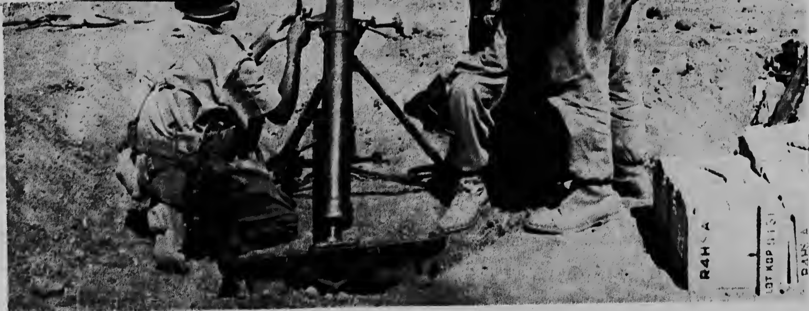
Te ainda tin incidentenan na e frontera entre Etiopia y Somalia na Afrika. E ar-